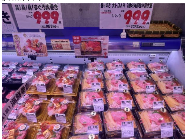
寿司、巻物に加えて海鮮丼も充実