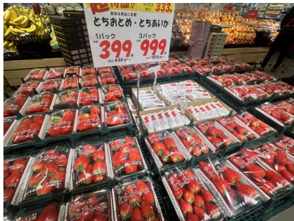
店頭にて旬のイチゴを売り出し