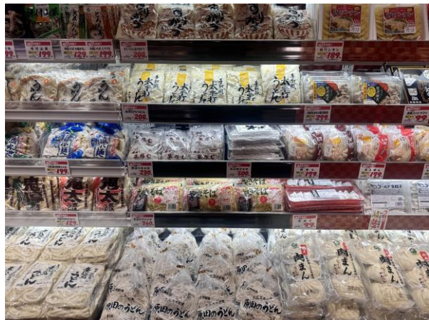
群馬県特産の「原田のうどん」を展開