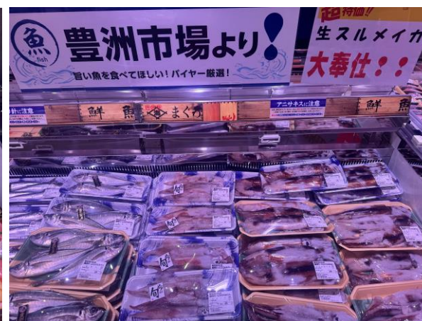
豊洲市場より丸魚・魚介類を毎日仕入れ