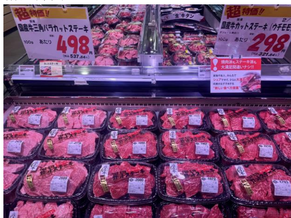
TOP名物のカットステーキ