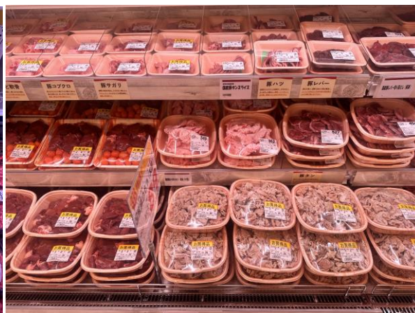
豚ホルモンの販売を拡大