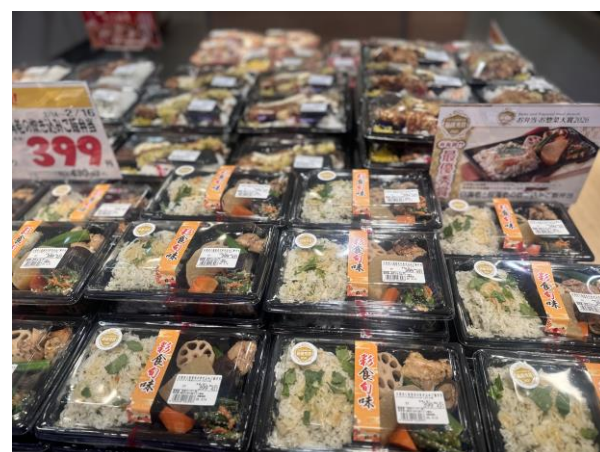
お弁当・惣菜大賞 2026 年 最優秀商品