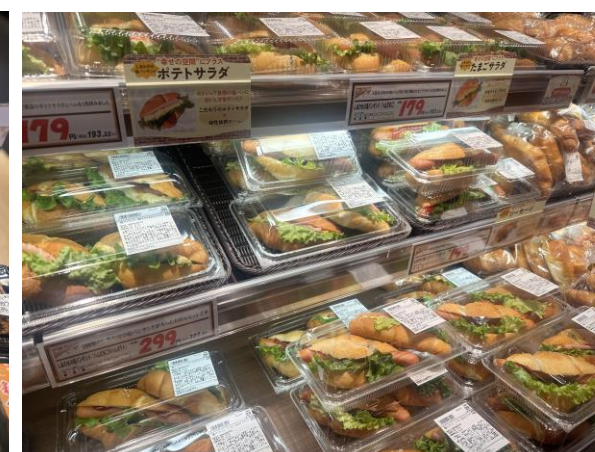
ベーカリー一番人気の塩パンのサンド